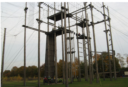
Europas größter Hochseilgarten steht in Kaltenkirchen.