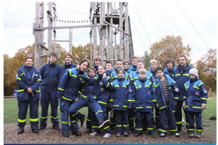
Gemeinsam mit Junghelfern aus Parchim wurden verschiedenste Hindernisse bewältigt.

Es bleibt ein Tag, an dem jeder ein wenig über sich hinausgewachsen ist, verstanden hat, wie wichtig der gemeinsame Weg für das Erreichen eines Ziels ist und wie ein Erfolg an Bedeutung gewinnt, wenn man sich gemeinsam darüber freuen kann. Und Niederlagen sind plötzlich nicht mehr nur negativ belegt, sondern werden als Ansporn begriffen.