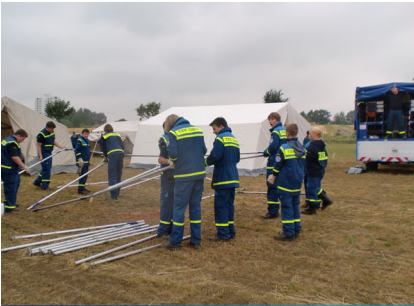
Wir stellten zwei Zelt auf, die uns für die nächsten Tage als Unterkunft dienen.