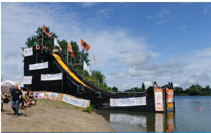
Beim Rutschen von einer 8,5 Meter hohen und 25 Meter langen Rampe...

Dann ging es erneut zum "ABFLUG!", um noch mal ausgiebig zu fliegen.