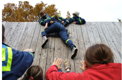
Gemeinsam musste eine Wand erklimmen werden.