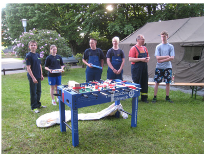
Das mitgebrachte Jubiläumsgeschenk.

Nach der Siegerehrung übergab unsere Jugendgruppe ein Jubiläumsgeschenk an die Jugendfeuerwehr Lohe-Rickelshof.