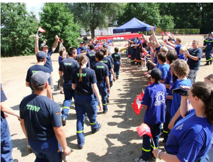
Antritt der Mannschaft aus Hamburg-Bergedorf zum Bundeswettkampf.