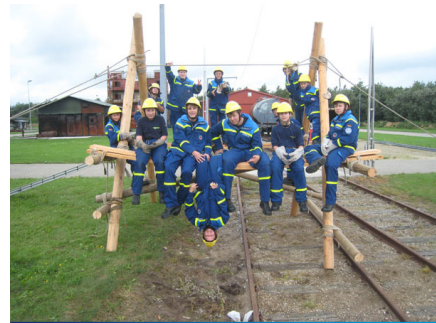
Gruppenfoto auf dem Trümmersteg.