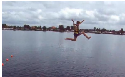
...konnte man bis zu 15 Meter weit durch die Luft ins Wasser fliegen.

Einen 20-minütigen Film gibt es auf unserer Homepage: www.thw-jugend-hamburg-nord.de