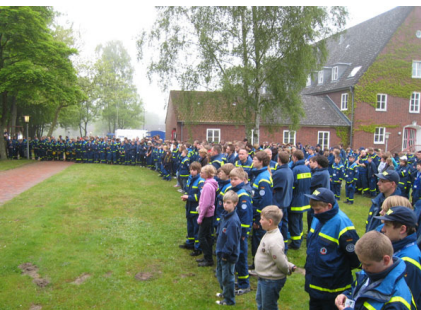
339 Junghelfer aus 28 Jugendgruppen nahmen teil.