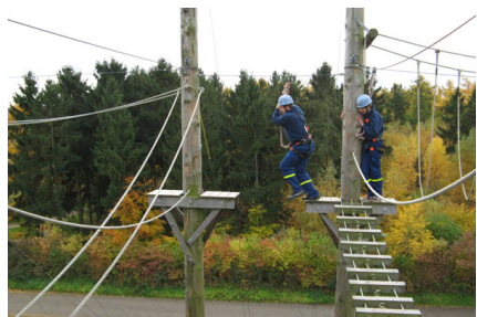
In 14 Metern Höhe wurden verschiedenste Hindernisse bewältigt.