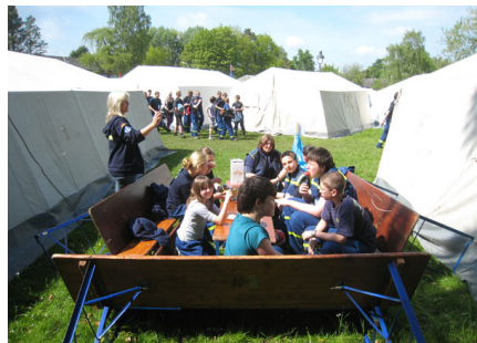
Unser „Besprechungsraum“ zwischen unseren Zelten.