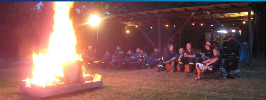
Am Abend fand die Übung dann einen gemütlichen Ausklang bei Bratwurst und Getränken am Lagerfeuer, um das Geübte noch einmal Revue passieren zu lassen.