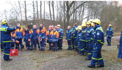
Neben Junghelfern aus dem Ortsverband Hamburg-Bergedorf und -Nord, nahmen auch Mitglieder der Jugendfeuerwehr Rissen an diesem Seminar teil.

Zunächst erfolgte eine Belehrung über die gesetzliche Regelung. Den Jugendlichen wurden die verschiedenen Klassen des Feuerwerks erklärt und wer mit welchem umgehen darf, sowie weiter wichtige Details zum Silvesterfeuerwerk.