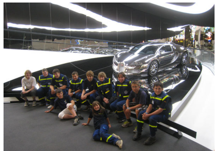
In der Autostadt.