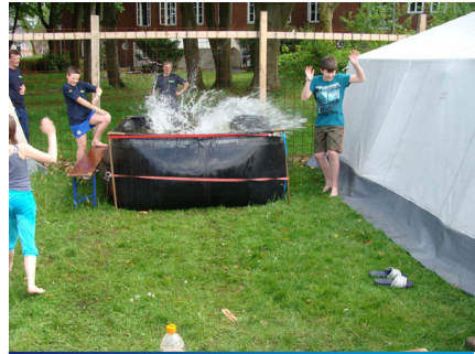
Spaß im „Pool“ zwischen unseren Zelten.