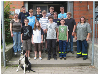
Viel gelernt und Spaß gehabt. Die Jungshelfer/innen aus den Ortsverbänden Hamburg-Nord, Hamburg-Bergedorf und Lübeck haben gemeinsam das Thema Zivilcourage behandelt und erarbeitet.