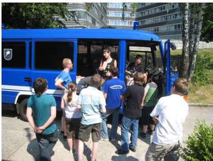
Fallbeispiel: Auf der Heimfahrt im Bus.

Als Fazit und Leitgedanke für die Jugendarbeit bleibt: Es ist wichtig über Zivilcourage zu reden und sich damit auseinanderzusetzen, aber noch wichtiger ist es, sie vorzuleben.