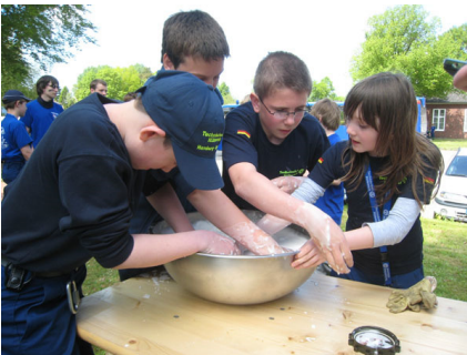
Eine Station bei der Lagerolympiade.