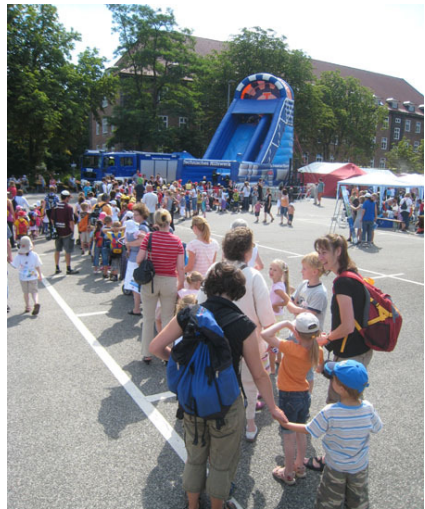
Warteschlange vor der Riesenrutsche.

Am 13. Juli 2010 war es wieder soweit. Auf dem Gelände der Landesbereitschaftspolizei fand wieder der Hit-Tag statt. Das THW stellte nicht nur ein Fahrzeug aus, sondern beteiligte sich mit einem Fahrzeug an den Rundfahrten um das Polizeipräsidium. Als großer Besuchermagnet erwies sich die THW-Riesenrutsche, vor der sich lange Warteschlangen bildeten. In die Betreuung der Riesenrutsche waren auch ein paar Junghelfer eingebunden.