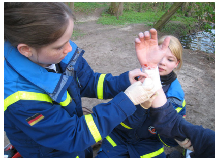
Eine der Aufgabenstationen: Erste-Hilfe.