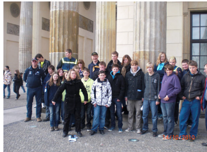
Die Teilnehmer der Studienfahrt vor dem Brandenburger Tor.

In zahlreichen Vorträgen haben die Teilnehmer viel über die deutsche Geschichte gelernt. Außerdem haben sie neue Freunde aus anderen Jugendgruppen gewonnen.