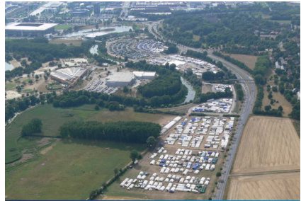
Unsere Jugendstadt erstreckte sich über zwei Kilometer. Sie war so groß wie 25 Fußballfelder.