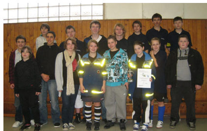
Gruppenfoto Hamburg-"Norddorf", also -Nord und -Bergedorf.