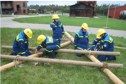
Unsere Jugendgruppe hatte die Aufgabe zugewiesen bekommen, einen Trümmersteg zu errichten.