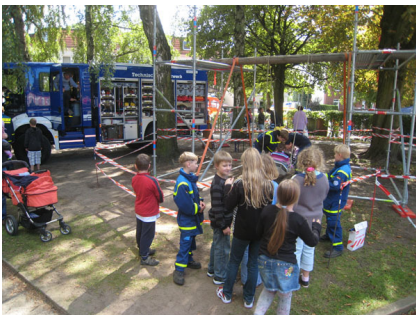
Unsere Jugendgruppe baute eine Schiffschaukel...

Auch unsere Jugendgruppe wurde eingeladen und baute eine Schiffschaukel. Drei Helfer der Fachgruppe Räumen boten Kindern Rundfahrten mit dem Radlader.