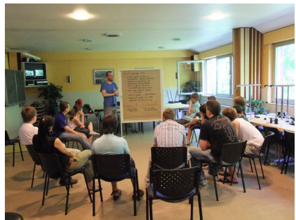
Eine gemeinsame Definition zum Thema Zivilcourage wurde bestimmt und die Einordnung des Begriffs anhand individueller Erfahrungen erarbeitet.