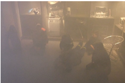
Der Raum wurde eingenebelt und das richtige Verhalten nach einem ausbrechenden Brand vermittelt.

Nun durfte eine „Einsatzfahrt“ mit dem HLF vor einer Filmleinwand gefahren werden. Blaulicht und Sondersignal durften natürlich nicht fehlen und wurden von unseren Junghelfern ausgiebig eingesetzt. Auch das Herunterrutschen über die Rutschstange wurde gerne angenommen.