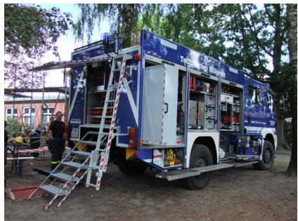
...und stellte einen Gerätekraftwagen aus.