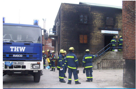
... hervorragende Übungsmöglichkeiten für Realdarstellungen.