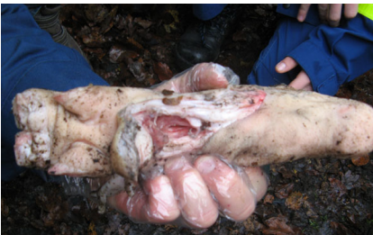
Mit einer Schweinepfote wurde eine menschliche Hand simuliert. Der unsachgemäße Umgang mit Knallkörpern kann zu schweren Verletzungen führen.

Mit einem Luftballon, der an einer Puppe befestigt war, wurde dargestellt, wie das Trommelfell schon bei leisen Böllern platzen kann.