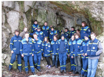
Gruppenfoto vor dem Kalkberg gemeinsam mit Jugendlichen aus den Ortsverbänden Lübeck, Kiel, Ratzburg, Bad Segeberg und Eutin.