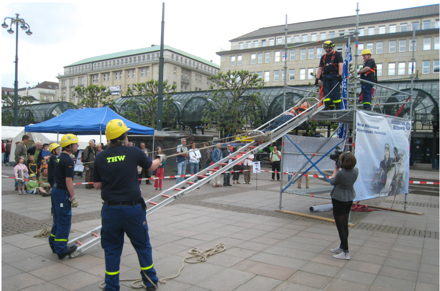
Unsere Jugendgruppe zeigte in regelmäßigen Vorführungen ihr Können. Über eine „Schiefe Ebene“ wurde eine Person aus einer Höhe gerettet.

Der Ortsverband Hamburg-Nord betreute das THW-Infozelt, stellt einen Gerätekraftwagen aus und betreute, gemeinsam mit THW-Jugend Hamburg-Eimsbüttel, eine Spielfläche für Kinder. Unsere Jugendgruppe zeigte in regelmäßigen Vorführungen ihr Können.