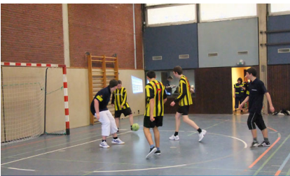
Angriff von gelb-schwarz gestreiften Sumsebießen? Nein, es ist die Mannschaft aus Hamburg-Bergedorf.

Wir freuten uns sehr über das überraschend gute Ergebnis, nachdem wir in den vergangenen Jahren nur die hinteren Plätze belegen konnten. Doch zählte auch in diesem Jahr wieder vorrangig das Mitmachen und das Treffen von Freunden.