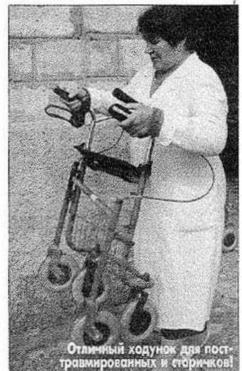
Отличный ходунок для посттравмированных и стариков!

Обстоятельные немцы тут же заехали в нее, вместе с главврачом прошли по очень бедным ее помещениям, Малу начитала на диктофон названия всех аппаратов и мебели, в